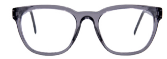
MUR Alles im Flow – der fließende Übergang in die ovale Form harmonisiert mit rundlichen wie eckigen Gesichtern.

KOSTENLOSER SEHTEST Wir bieten Ihnen einen kostenlosen Sehtest mit fachkundiger Beratung, damit Sie immer mit den richtigen Gläsern unterwegs sind. Unabhängig vom Sehtest sollte eine regelmäßige Überprüfung des allgemeinen Gesundheitszustandes der Augen bei einem Augenarzt erfolgen.