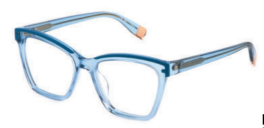
FURLA Ecken, Kanten sowie raffinierte Details an der Front führen einen unverwechselbaren Look vor Augen.