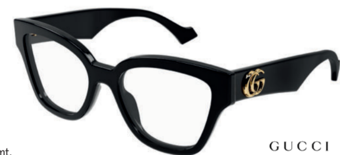
GUCCI Mit voller Wucht! Ein breites Bügeldesign demonstriert Selbstbewusstsein und verleiht pures Luxusgefühl.