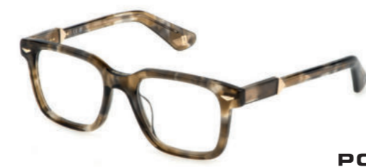
POLICE Buongiorno! Exklusives, marmoriertes Acetat trifft auf markante Proportionen in italienischem Flair.