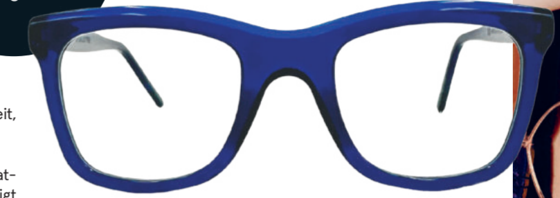
SPITTELBERG Füllige Ränder verkörpern reges Treiben, künstlerische Schöpferkraft sowie gemütliche Behaglichkeit.

Die Marke ist made in Austria, trotzdem im heimischen Markenvergleich preiswert. Jeder Kauf einer Scharfsinn-Fassung stärkt eigenständige, unabhängige Optikerbetriebe und belebt auch die heimische Wirtschaft.