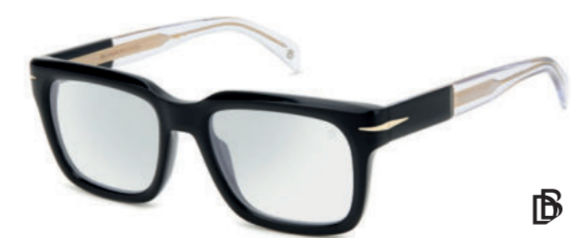
DAVID BECKHAM Die stilisierte Raute an den oberen Kanten und die Drahtkernkonstruktion an den Bügeln bezeugen David B.