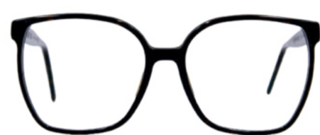
WÖRTHERSEE Volltreffer! Bühne frei für die 70er Jahre. Die weiten, quadratischen Rahmen passen perfekt zu jedem Retro-Look.